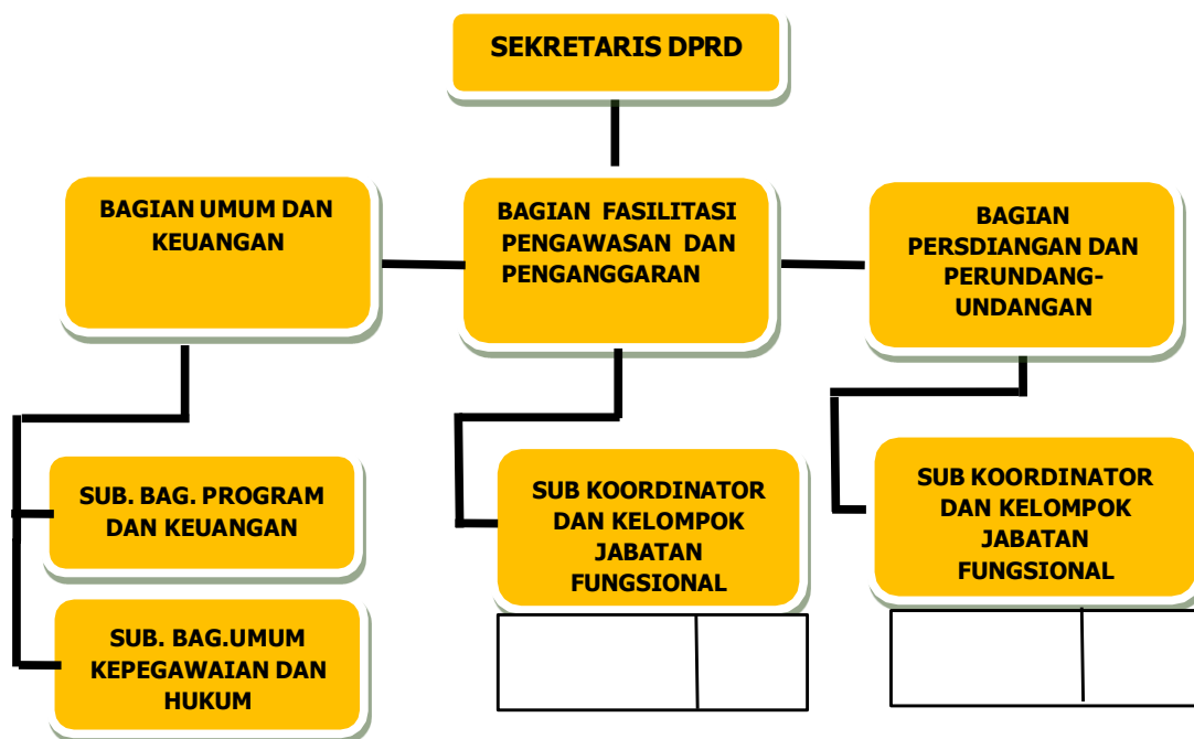
Gambar 2.2 STRUKTUR ORGANISASI SEKRETARIAT DEWAN PERWAKILAN RAKYAT DAERAH KABUPATEN KEPULAUAN SELAYAR Setelah Perubahan Renstra Tahun 2021-2026

Sumber : Data Kepegawaian Sekretariat DPRD Kab. Kep. Selayar Tahun 2023